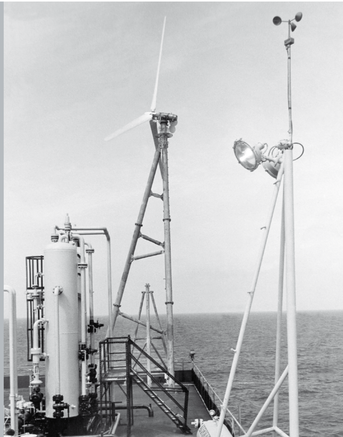
↑ Die weltweit erste Offshore-Windkraftanlage, 1958