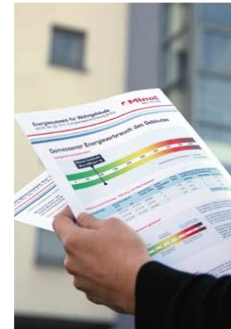
↑ Verbrauchs- und bedarfsbasierte Energieausweise schaffen Transparenz hinsichtlich des Energieverbrauchs

Eine eigenentwickelte Funktechnologie erlaubt es Minol nicht nur, Verbrauchsdaten von außerhalb der Wohnung auszulesen, sondern lässt auch ein permanentes Beobachten und Analysieren von Verbrauchsverläufen zu. Ein Beitrag zur Steigerung der Energieeffizienz in Wohnungen und Gewerbeeinheiten ist damit sehr einfach