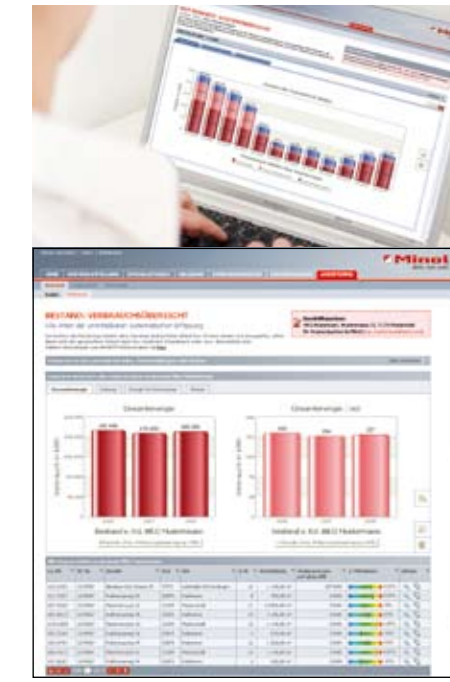
↑ Minol Online-Services für die effiziente Verwaltung von Immobilien

zu erbringen. In die Datenübertragungsnetze eingebunden werden können neben Wärme- und Wassermessgeräten auch intelligente Strom-, Gaszähler sowie eine Vielzahl weiterer Arten von Verbrauchszählern, wodurch alle Verbrauchsinformationen einer Immobilie für Analysen und Bewertungen sofort bereitstehen.