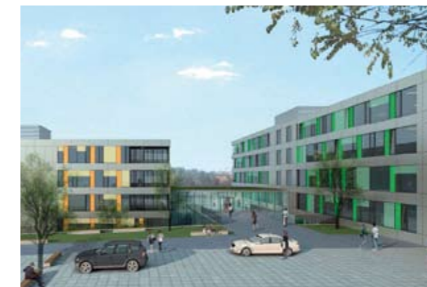
↑ Neubau des Zentrums für Seelische Gesundheit in Bad Cannstatt →