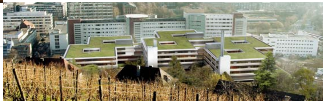
↑ Neubau Olgahospital/Frauenklinik – Blick vom Killesberg